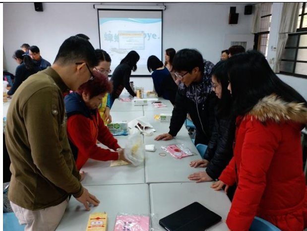
說明：環教體驗-蟑螂餅的製作。