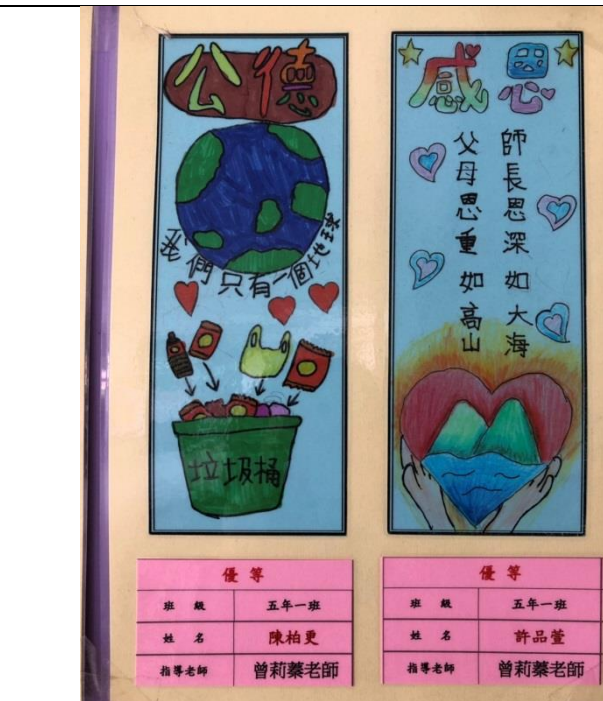
說明：舉辦環保書籤比賽。