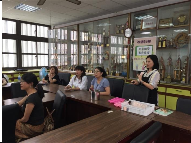
說明：教師手工皂製作研習，推廣資源再利用。