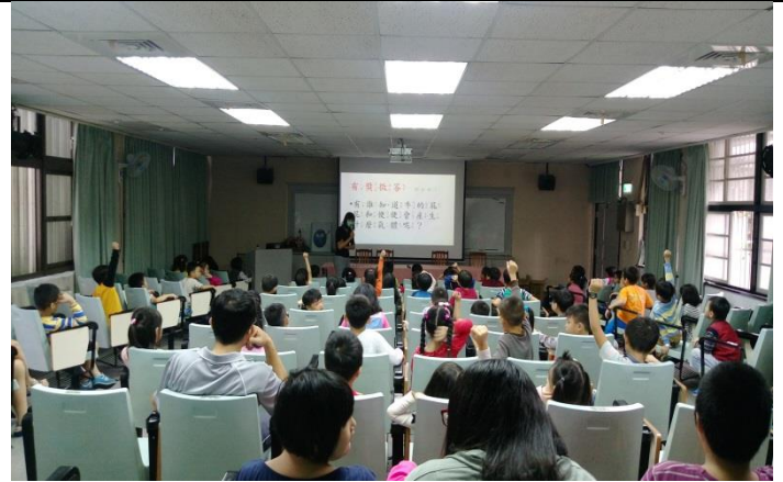
說明：環教宣導-蔬食救地球。