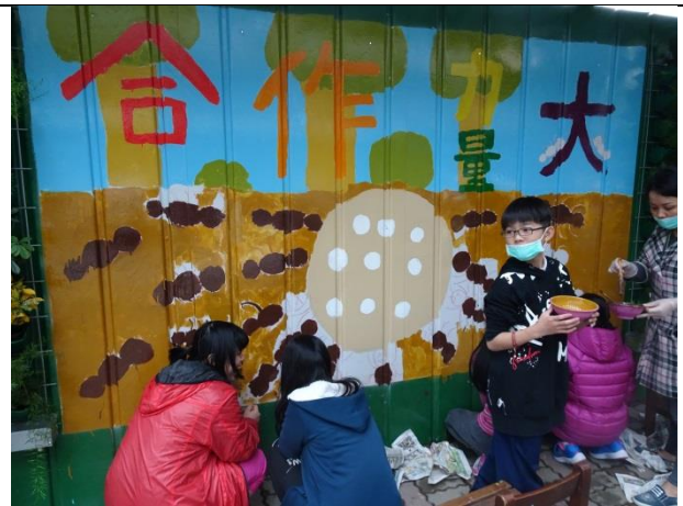
說明：環境美化-美化彩繪外牆活動。