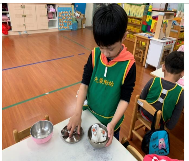
說明：每天孩子們用餐後使用的紙巾量很驚人，帶孩子觀看紙巾製作與樹木關係的環保影片，討論並提供可清洗重複使用的紗布巾來代替紙巾，減少紙巾用量，愛護環境。