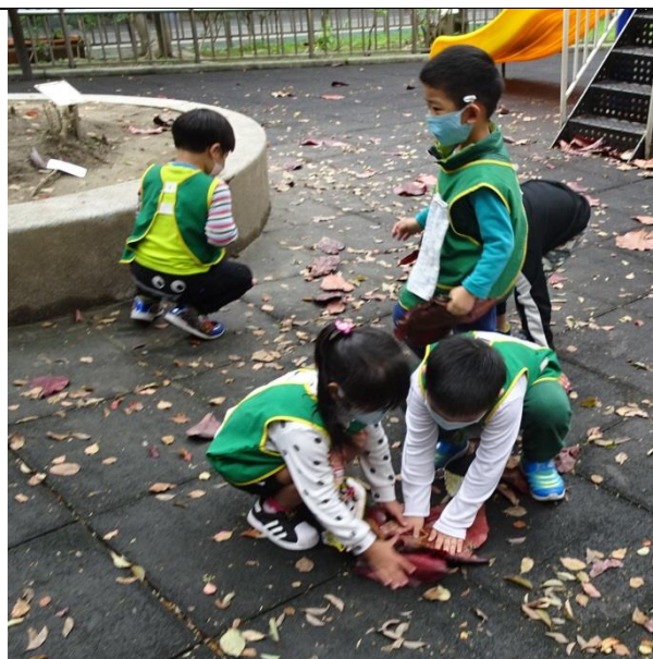
說明：從遊戲時活動中，與孩子們還共同創作了防疫口號：「團隊合作，所向無敵，打敗病毒！」