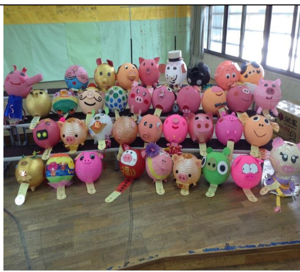
說明：彩繪花燈比賽，配合中國傳統年節活動，傳承傳統藝術，鼓勵親子共同製作，增進親子感情，並提昇學生美育情操。美化校園環境，營造一個兼具美感與環保的友善校園。