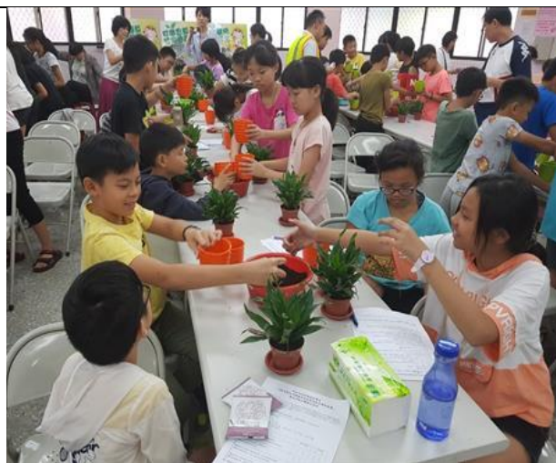
說明：藉由參訪低碳績優里，親身感受里長與里民共同用心打造的低碳家園，並融合環境教育DIY實作，增進學生的參與感。