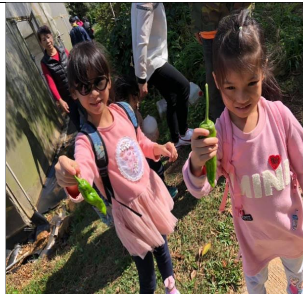
說明：從參訪活動中，讓家長會成員及孩子們了解有機農業不破壞生態，以友善耕作方式對待土地，生生不息的自然循環，讓生長出來的蔬菜自然吃得更安心