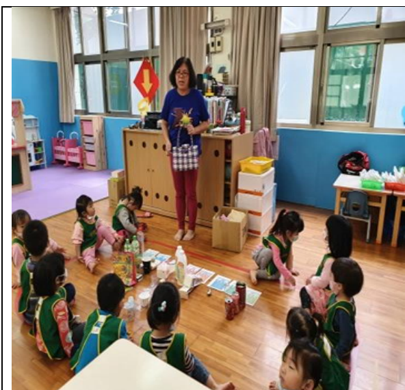
說明：介紹可回收的資源垃圾。