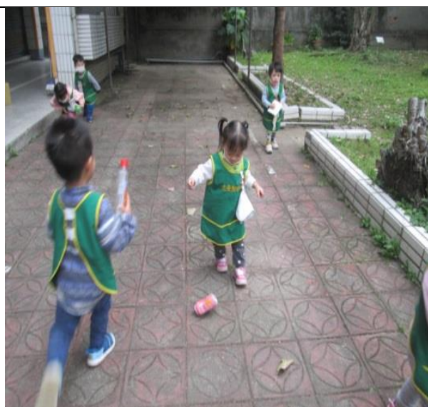
說明：大肌肉活動：瓶罐踢踢樂。